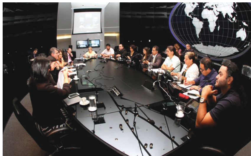
As negociações com a direção do banco no GT bipartite vão continuar em Brasília