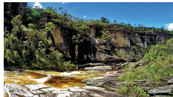
A natureza exuberante do Parque Estadual é a principal atração de Conceição do Ibitipoca

A Secretaria de Cultura, Esportes e Lazer do Sindicato realiza de 18 a 21 de maio, uma excursão a um dos mais belos roteiros ecológicos da Região Sudeste: Conceição do Ibitipoca, distrito de Lima Duarte, em Minas Gerais, bem pertinho da Região Serrana. O lugarejo possui um centrinho charmoso, com restaurantes de comida variada e, é claro, a imperdível gastronomia mineira, além de pousadas aconchegantes. Outra surpresa é o pão de canela, uma tradição da região.