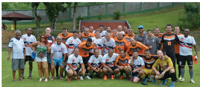
Os atletas do Itaú Sede de Bola prestaram homenagem à Comissão Organizadora da Copa Veteranos