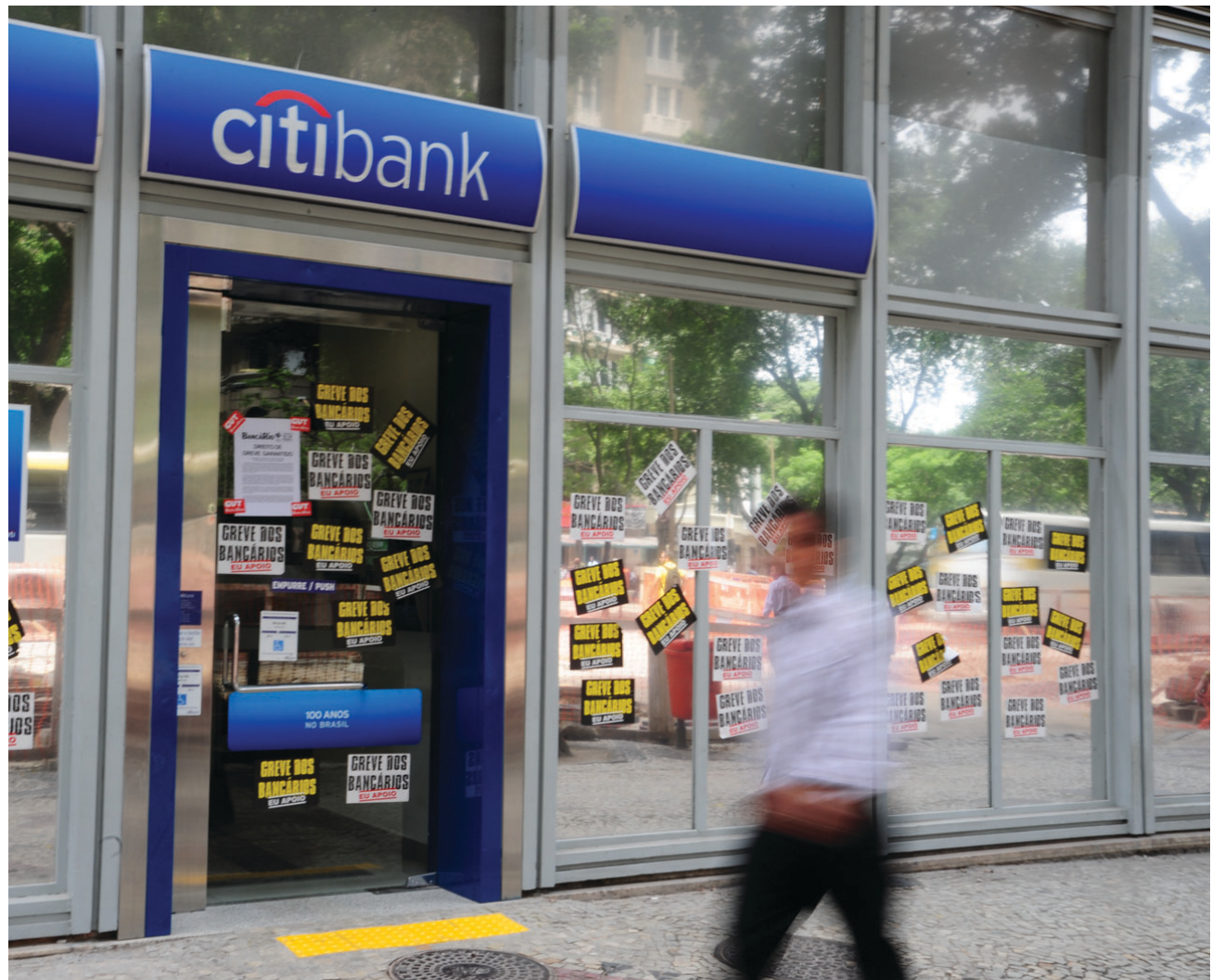
O Sindicato quer garantir o emprego dos funcionários do Citibank, que anunciou a pretensão de deixar o Brasil

Os bancários do Citibank participam, nesta terça-feira, 15, da Primeira Jornada Internacional de Luta no Citibank . Na pauta, a manutenção dos postos de trabalho. O banco já anunciou que vai sair do Brasil. O Sindicato quer garantir os direitos dos bancários e bancárias, impedindo demissões no banco e garantindo o pagamento de horas extras, por exemplo, mais uma irregularidade que a empresa tem praticado há muito tempo.