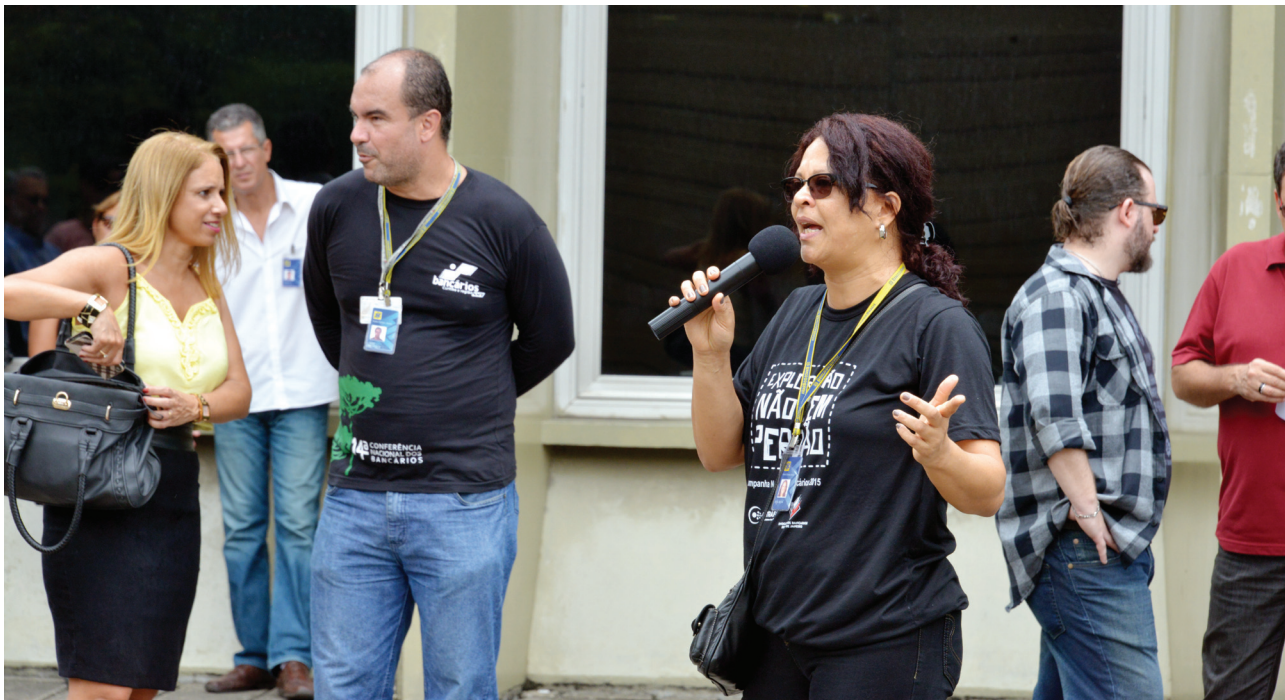
O Sindicato estuda medidas políticas e jurídicas para garantir os direitos dos funcionários atingidos pelo desmonte