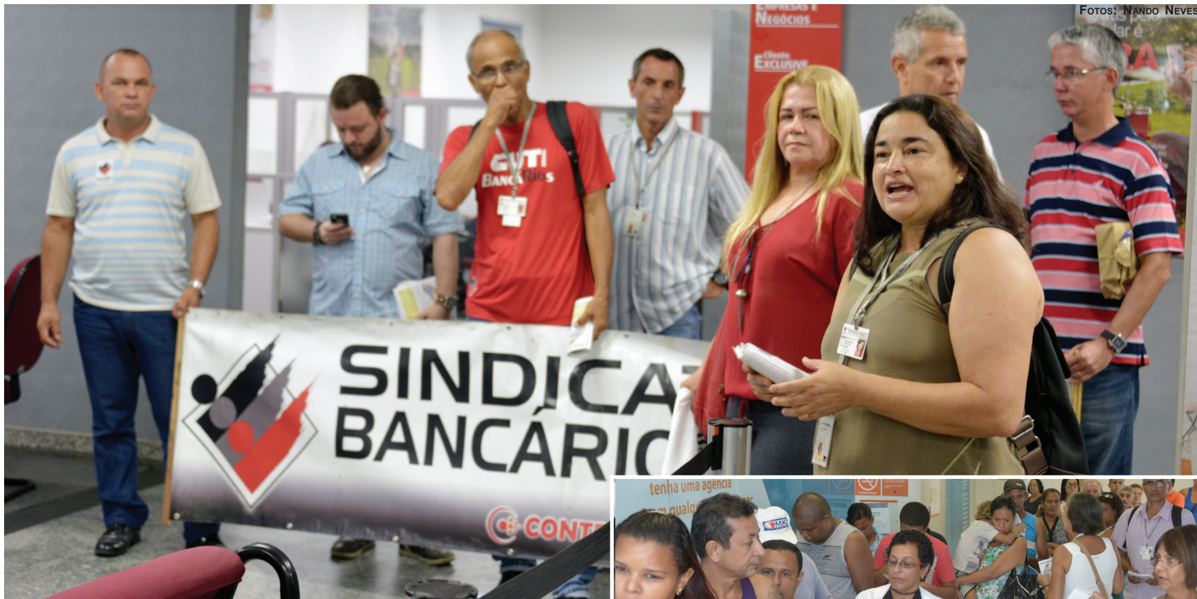
Em Copacabana, dirigentes sindicais protestam contra a obrigatoriedade da venda de produtos nos caixas

Desrespeito à Lei da Fila é flagrado tanto em agências de Copacabana como de Santa Cruz