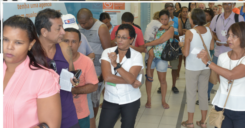
Santa Cruz: sindicalistas conversam com clientes que esperam atendimento no Itaú Unibanco