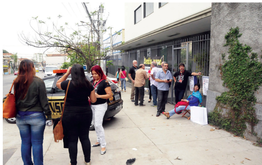
Paralisação do call center do Santander, no dia 29 de setembro, Dia Nacional de Lutas. Os bancários do Rio mostraram que estão preparados para uma forte greve

Bancários de todo o Brasil entram em greve, a partir de hoje (5), por tempo indeterminado. O Comando Nacional da categoria anunciou que o mínimo para o retorno do diálogo é uma proposta que