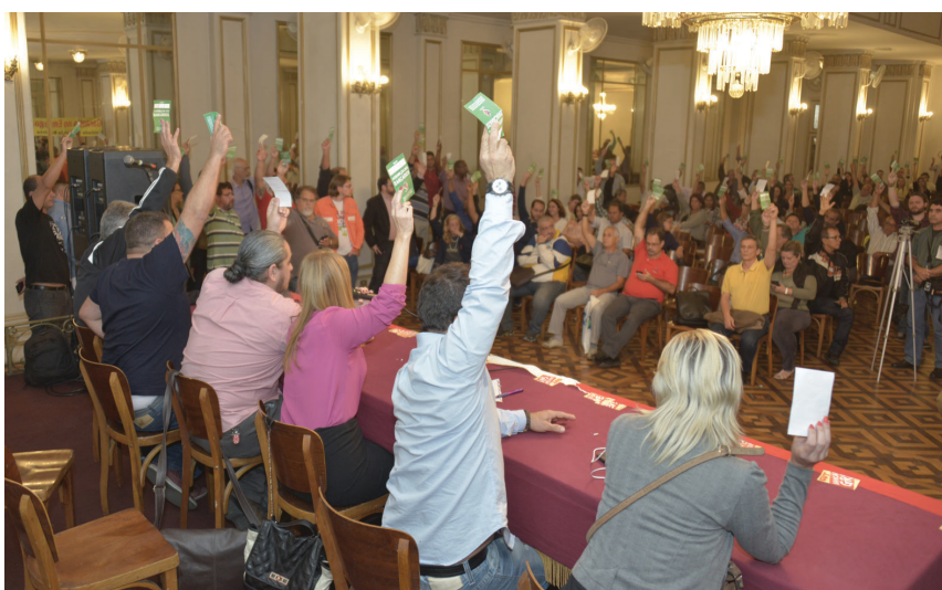
Assembleia realizada ontem (5) definiu as estratégias da organização da greve. Êxito da campanha depende da participação de todos os bancários e bancárias

Bancários param em todo o país e avisam que, sem aumento real de salário, não tem acordo