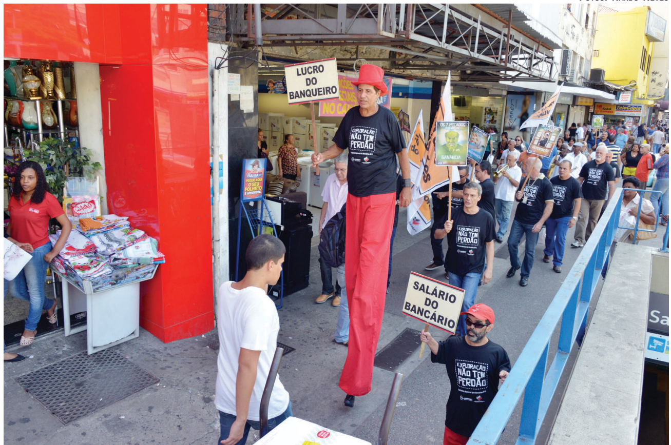
Atividade na Tijuca é para organizar a mobilização da categoria na campanha salarial