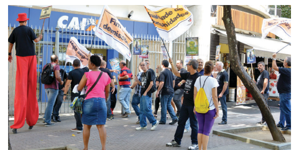
Sindicalistas chegam a uma agência da Caixa, na primeira caravana realizada para pressionar as negociações da categoria com a Fenaban