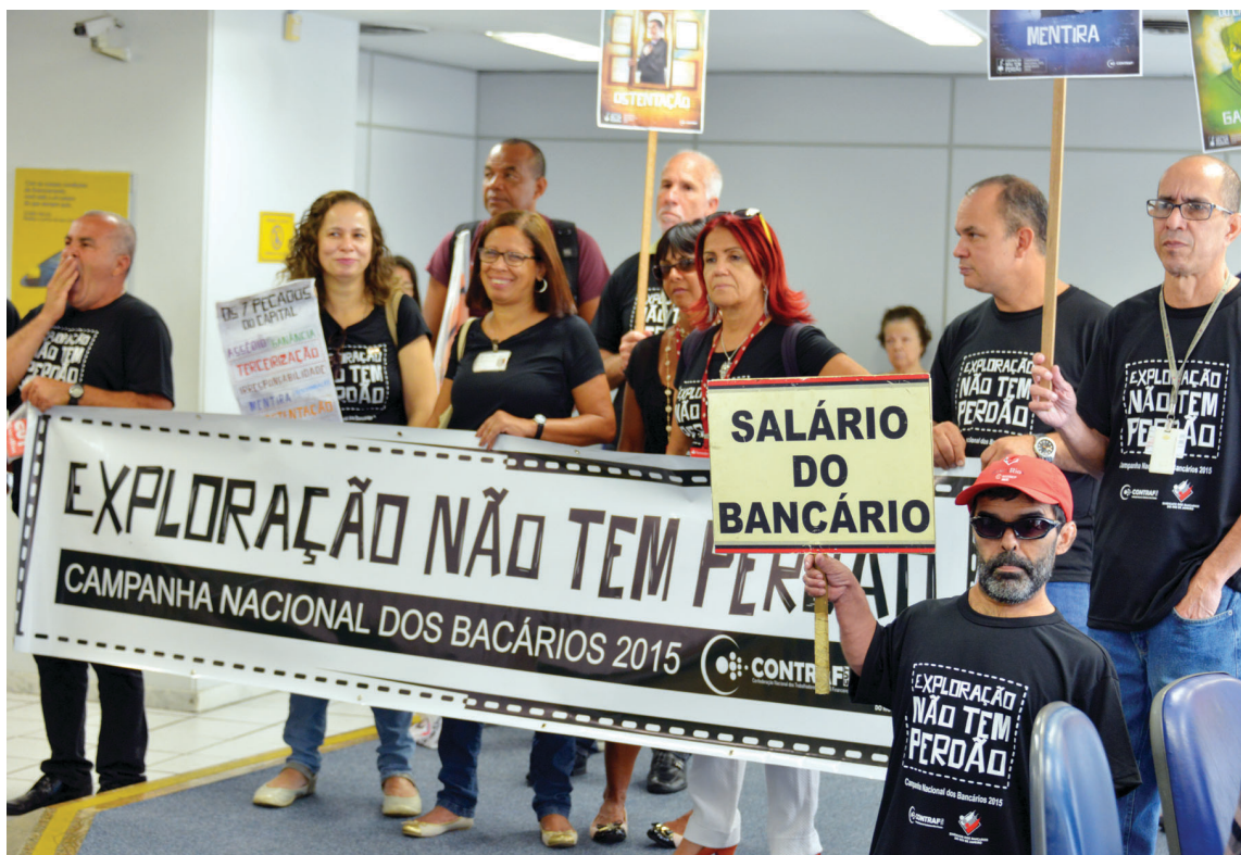
Na caravana, dirigentes sindicais levaram faixas com o mote da campanha salarial 2015