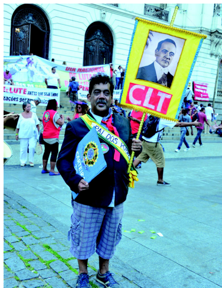
Manifestante levou retrato de Getúlio Vargas em defesa da CLT. Trabalhadores seguiram para a sede da Firjan, onde os sindicalistas da CUT e da CTB voltaram a protestar contra o PL 4330