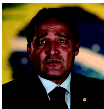
Deley - PTB