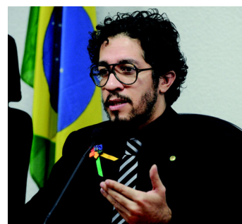
Jean Wyllys - PSOL