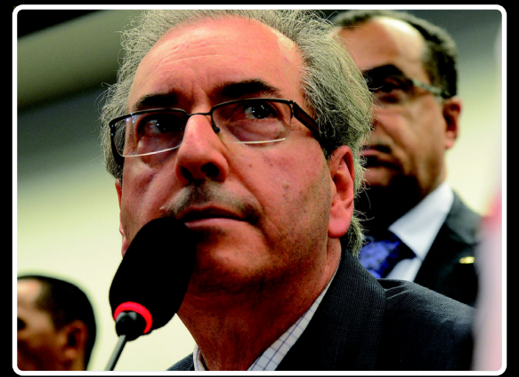
Eduardo Cunha (PMDB-RJ): O presidente da Câmara dos Deputados não votou por regulamento da casa, mas é o principal articulador do PL 4330

Confira os nomes dos deputados federais que votaram a favor do PL 4330/2004, projeto que rasga a CLT (Consolidação das Leis do Trabalho), retira direitos e reduz a média salarial dos brasileiros. Fique de olho. Distribua a lista para amigos e familiares. Em 2018 eles voltarão a pedir o seu voto.