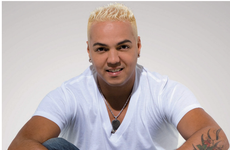
O cantor Belo será a grande atração da Festa do Dia do Bancário no Circo Voador

Inscreva-se pelos telefones 2103-4150, 2103-4151 ou 2103-4106 para garantir seu convite individual, já que o evento estará sujeito a lotação. O contato é o mesmo para quem optar pela compra antecipada de cerveja no Sindicato com o valor de R$ 2 a lata. Quem preferir poderá comprar a bebida no local, com preço da casa. As vendas serão a partir do dia 21 de julho e vão até 22 de agosto.