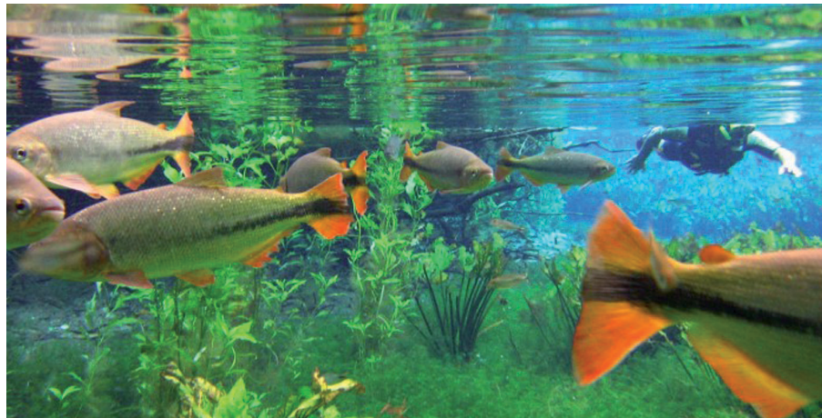
Mergulhar nas lagoas de Bonito estão entre as principais atrações da excursão organizada pelo Sindicato para as férias de janeiro de 2015

A Secretaria de Cultura, Esportes e Lazer do Sindicato vai realizar um maravilhoso passeio nas férias de janeiro do ano que vem. Mas as inscrições já podem ser feitas pelo telefone 2103-4141/4142. De 24 a 31 de janeiro está prevista uma excursão a Bonito (MS), que é um excelente destino com diversas opções de passeios e lugares encantadores para você conhecer. É um roteiro para a contemplação ou mesmo de aventura em meio a uma