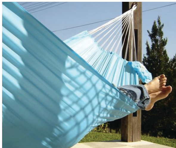
RELAXE E APROVEITE - Os bancários merecem mais um dia de folga, conquista prevista na Convenção Coletiva da categoria

O banco que já concede outro benefício que resulte em folga, como “faltas abonadas” e “folga de aniversário”, fica desobrigado de cumprir esta cláusula.