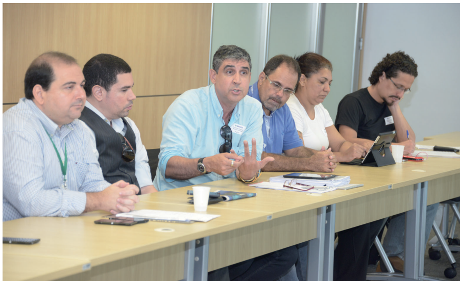
Diretores do Sindicato e da Contraf-CUT participaram da negociação com a direção do BNDES

Os diretores do Sindicato, da Contraf-CUT e das associações de empregados exigiram que, na próxima negociação, dia 17, às 15 horas, o banco apresente uma proposição global, com cronograma de implantação da GEP Carreira, com efeitos retroativos a 1º de julho, data determinada pelo acordo coletivo para a implantação do plano de carreira.