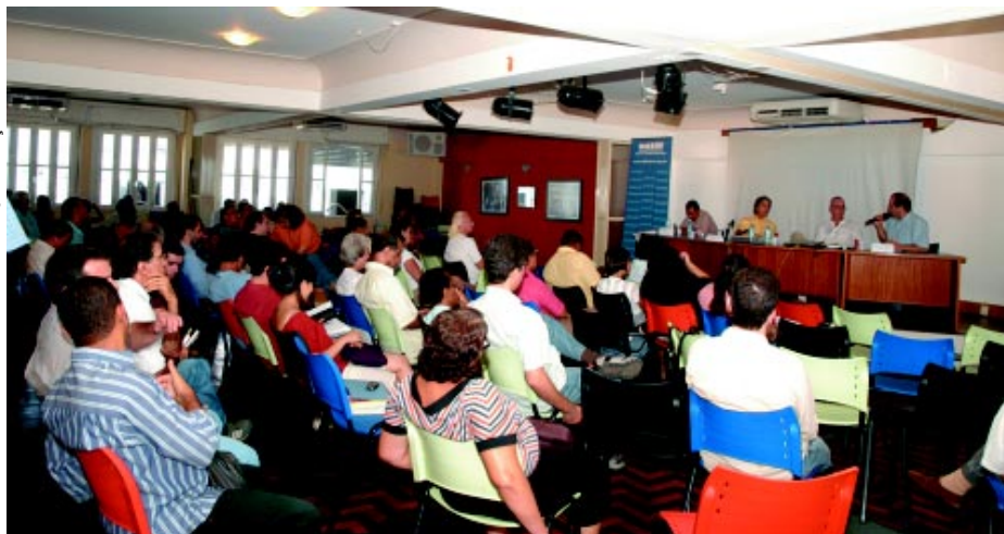
CAPITAL E TRABALHO - Participantes debatem as necessidades de transformação da estrutura sindical frente às mudanças da sociedade capitalista e do mundo do trabalho

tegoria que representa, mas interferir em outras áreas que afetam a vida dos associados”. Citou como exemplo a luta por melhoria nos locais de moradia, por