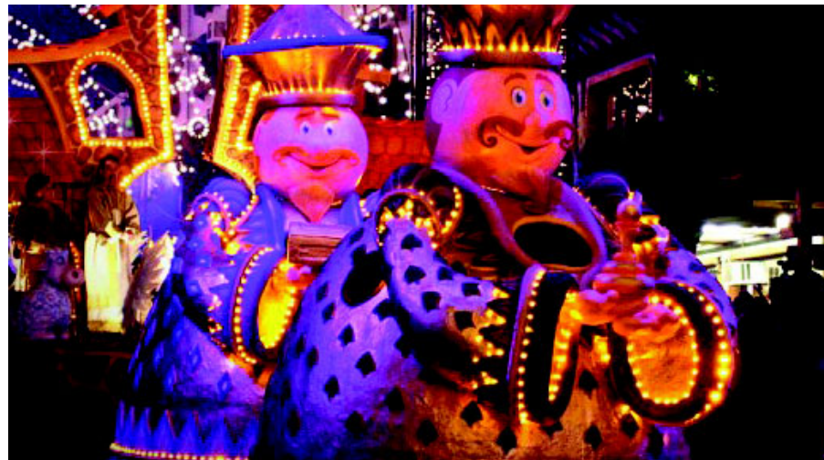
Gramado é uma das mais famosas estâncias climáticas do Brasil e um roteiro muito procurado por casais e famílias

Vassouras 21/7 - No pacote estão incluídos traslado em ônibus com ar-condicionado, café da manhã e almoço. O retorno será no mesmo dia. O preço é R$150, mas bancários sindicalizados pagam R$125. Crianças de 5 a 10 anos