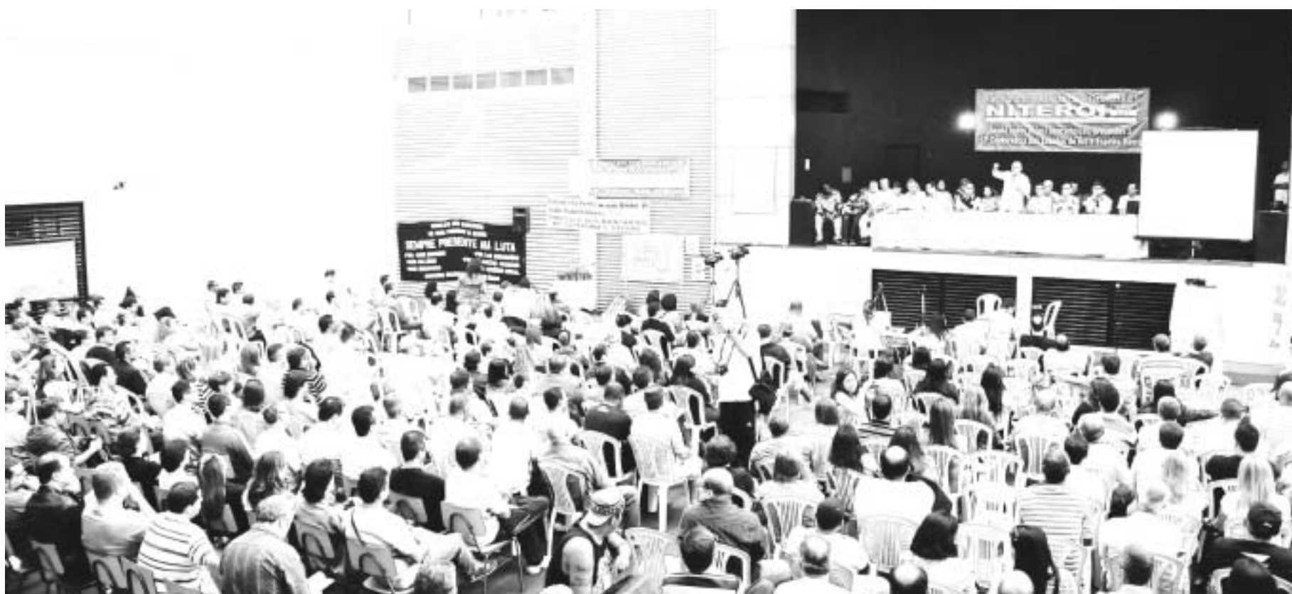
Cerca de 600 pessoas, entre bancários e convidados, participaram da 13ª Conferência Interestadual dos Bancários RJ/ES