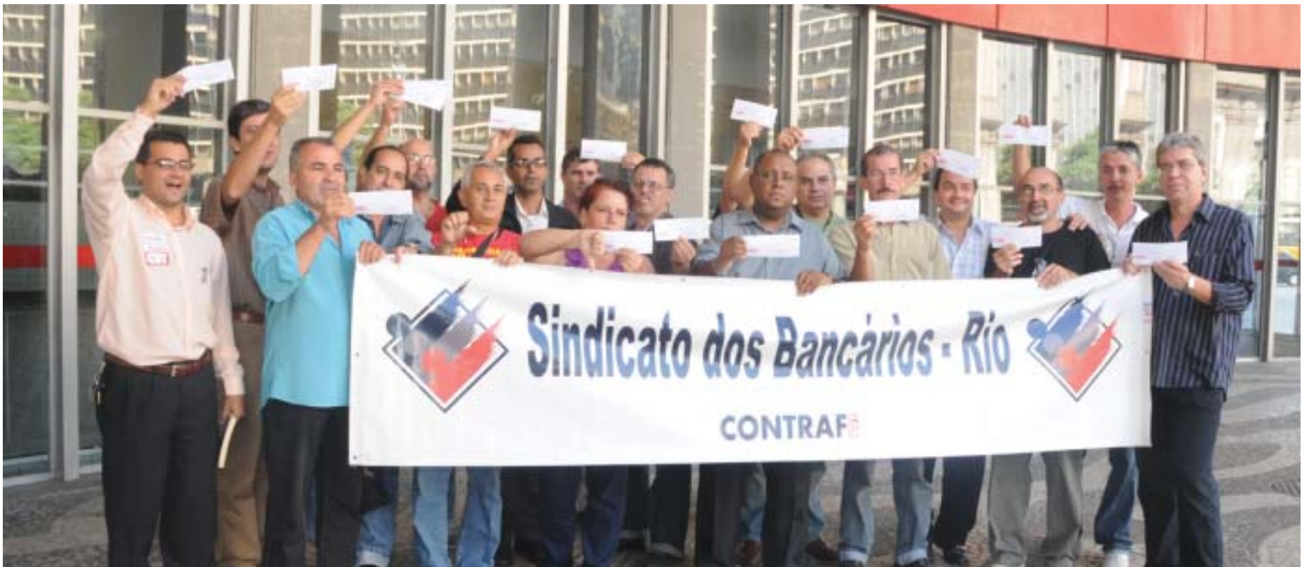
Funcionários do Santander Real e a população deram total apoio ao protesto promovido pelo Sindicato contra a injusta política de distribuição dos lucros do grupo espanhol

Sindicato cobra PLR justa para todos os funcionários do Santander Real