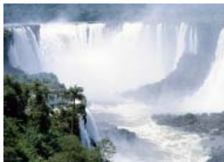
BRASIL LINDO DEMAIS - As cataratas são uma das principais atrações do Parque Nacional do Iguaçu, Patrimônio Natural da Humanidade

A cidade de Foz do Iguaçu, no extremo oeste do Estado do Paraná, com suas lindas cataratas, é um dos roteiros mais procurados pelo turismo nacional. Não é por acaso. O Parque Nacional do Iguaçu, tombado em 1986 pela Unesco como Patrimônio Natural da Humanidade, é uma das mais belas reservas naturais do planeta. O Sindicato realiza de 7 a 14 de dezembro uma excursão para uma das últimas e mais belas reservas da Mata Atlântica. O pacote custa R$1.200 por pessoa. Mais informações pelos telefones 2103-4150/4151.