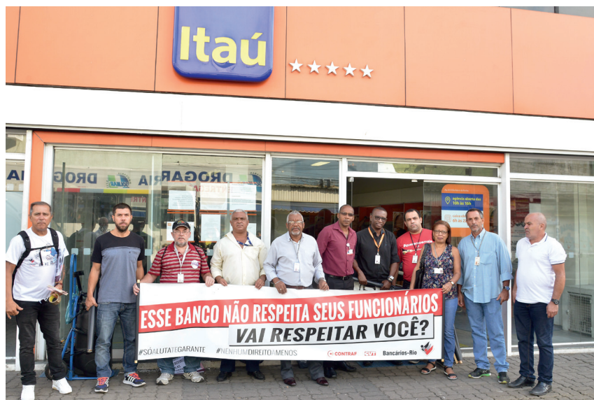
Agência Penha paralisada contra o assédio moral. Outras 26 unidades também ficaram paradas na semana passada contra as perseguições do GSO

Funcionários de 26 agências denunciam o mesmo gerente por práticas abusivas e ameaçadoras. Silêncio do banco incomoda