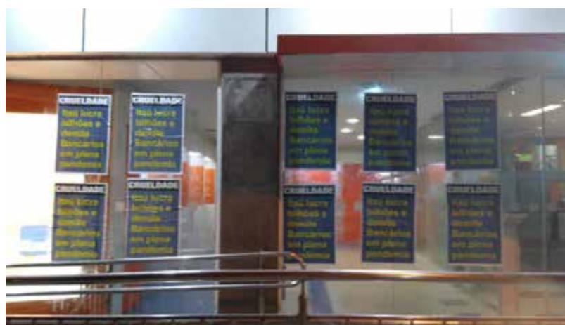
No Itaú os funcionários também denunciam as dispensas em plena pandemia

“Os bancários e bancárias do Rio estão inseridos nesta campanha nacional e é muito importante a participação de todos. Os bancos gastam uma fortuna com publicidade para tentar sensibili-