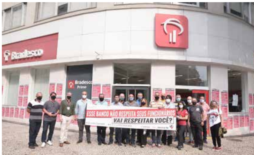
O Sindicato protestou contra as demissões no Bradesco, mais um banco a descumprir o acordo com a categoria e dispensar funcionários durante a pandemia