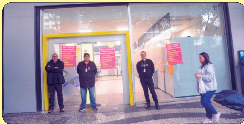
Dirigentes sindicais do Rio de Janeiro na greve dos funcionários do BB: direito de greve é legítimo

das garantias do direito de greve dos trabalhadores.